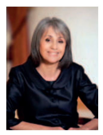
ПРИВЕТСТВИЕ ОТ Г-ЖА МАРГАРИТА ПОПОВА, ВИЦЕПРЕЗИДЕНТ НА РЕПУБЛИКА БЪЛГАРИЯ, ПО ПОВОД 25-ТО ЮБИЛЕЙНО ИЗДАНИЕ НА ДНИТЕ НА ЯПОНСКАТА КУЛТУРА

Настоящата 2014 г. ни поднесе емблематично съвпадение – отбелязваме 55 години от възстановяването на дипломатическите отношения между нашите две държави и провеждането на 25-то издание на Дните на японската култура в България.