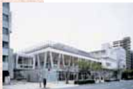
© SHINKENCHIKU-SHA (JAPAN ARCHITECT vol.65 "PARALLEL NIPPON")