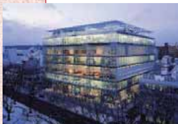
© SHINKENCHIKU-SHA (JAPAN ARCHITECT vol.65 "PARALLEL NIPPON")