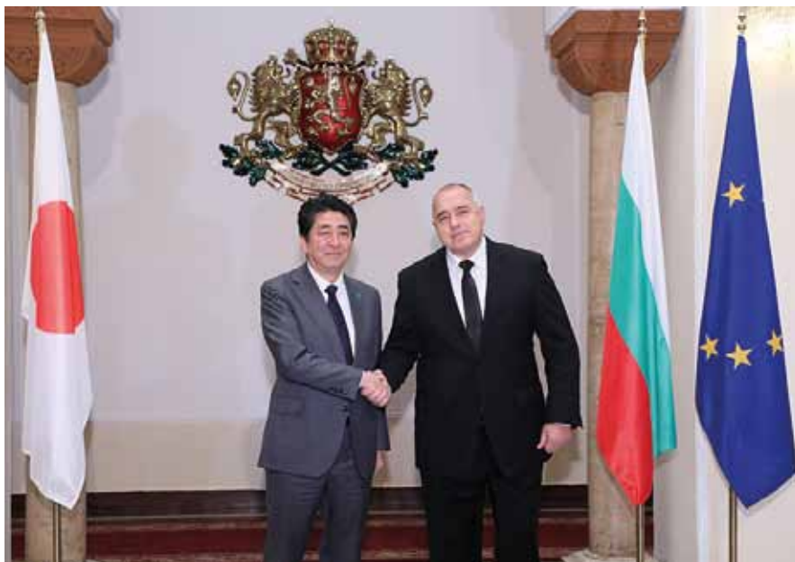
Историческа среща на японския и българския премиер

Премиерите Абе и Борисов бяха единодушни, че категорично не приемат ядреното въоръжаване на Северна Корея и смятат, че чрез различни мерки, включително и чрез строги санкции от страна на Съвета за сигурност на ООН, трябва да ѝ се окаже максимален натиск и да бъде принудена да промени агресивната си политика.