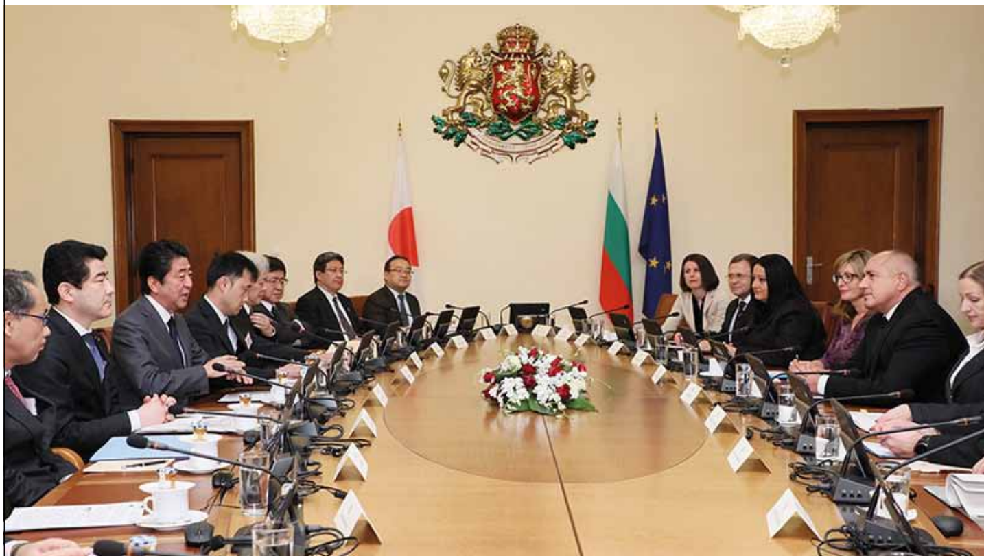
Среща на премиерите на Япония и България

На 14 януари японският премиер Шиндзо Абе се срещна с българския си колега Бойко Борисов. Официалните разговори между двамата в Министерски съвет продължиха около 50 минути.