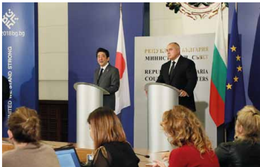
Съвместно изявление за пресата след края на срещата

По повод на Северна Корея, премиерът Абе отбеляза, че страната му разчита на сътрудничеството си с България, тъй като Северна Корея продължава да изстрелва баллистични ракети, които потенциално могат да достигнат дори София, и с поведението си представлява заплаха за цяла Европа.