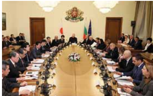
Моменти от разширената среща между японския и българския премиер и представители на бизнеса

След срещата между двамата премиери, беше проведена среща в разширен формат, на която освен Шиндзо Абе и Бойко Борисов, присъстваха представители на японските и българските бизнес среди. По време на разговорите между двете страни, продължили около 35 мин., премиерът Абе предложи създаването на Японски бизнес