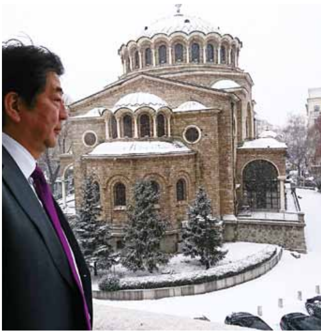
На балкона на хотел в България

Програмата на посещението включваше срещи на премиера Абе с българския му колега Бойко Борисов и с президента на Република България ген. Румен Радев, по време на които открито бяха обменени мнения по належащи за цялата международна общност въпроси и беше затвърдено партньорството между Япония и България.