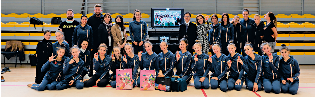
Обща снимка от церемонията