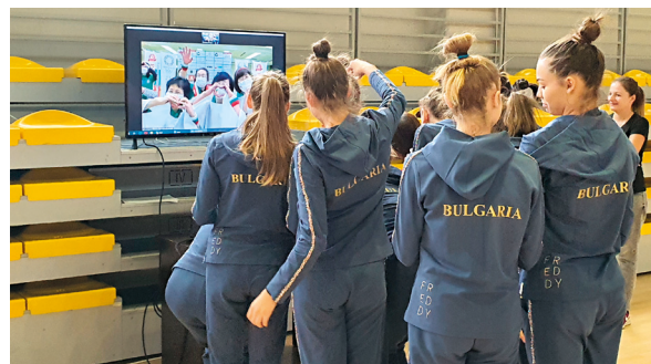
Видеоразговор с фен клуба на „Златните момичета“