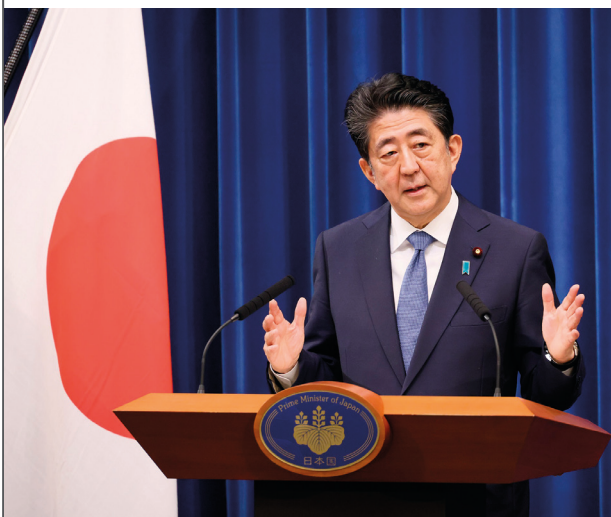
Бившият премиер Абе