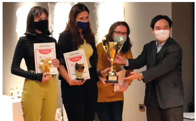
Награждаване на победителите