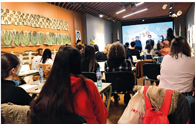
Поздрав от посланик Нарахира

ра. Първите три отбора в квалификациите преминаха на финалния решаващ кръг. На печелившите отбори, заели от 1-во до 3-то място, бяха връчени трофеи, грамоти и други награди, а всички останали участници получиха маски с японски мотиви, както и оригинални тениски за спомен от състезанието. След края на викторината, се състоя демонстрация по айкидо, представена от местната школа „Aiki School“.